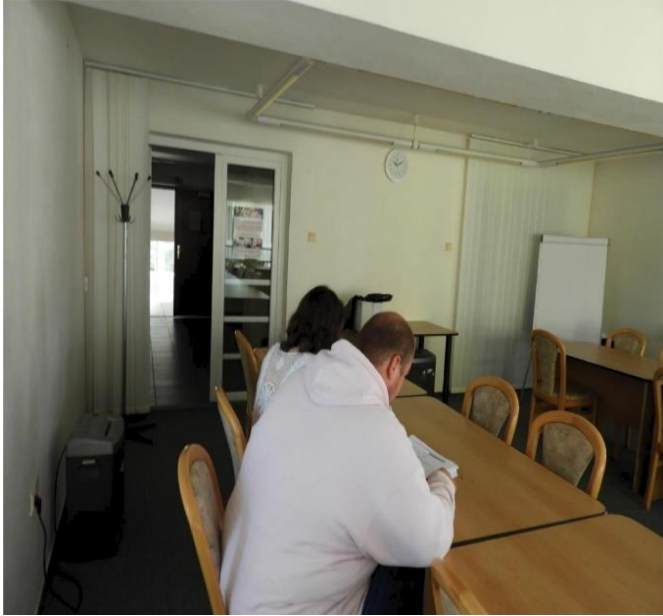
Foto č. 2 Úrad práce, sociálnych vecí a rodiny Martin, náplň práce prijatého absolventa: Vykonávanie činností v oblasti služieb zamestnanosti a ekonomiky

https://www.upsvr.gov.sk/ds/sluzby-zamestnanosti/narodne-projekty-v-programovom-obdobi-2014-2020/narodny-projekt-absolventska-prax-startuje-zamestnanie.html?page_id=538221 https://www.youtube.com/watch?v=Bn1w6GaNp-A