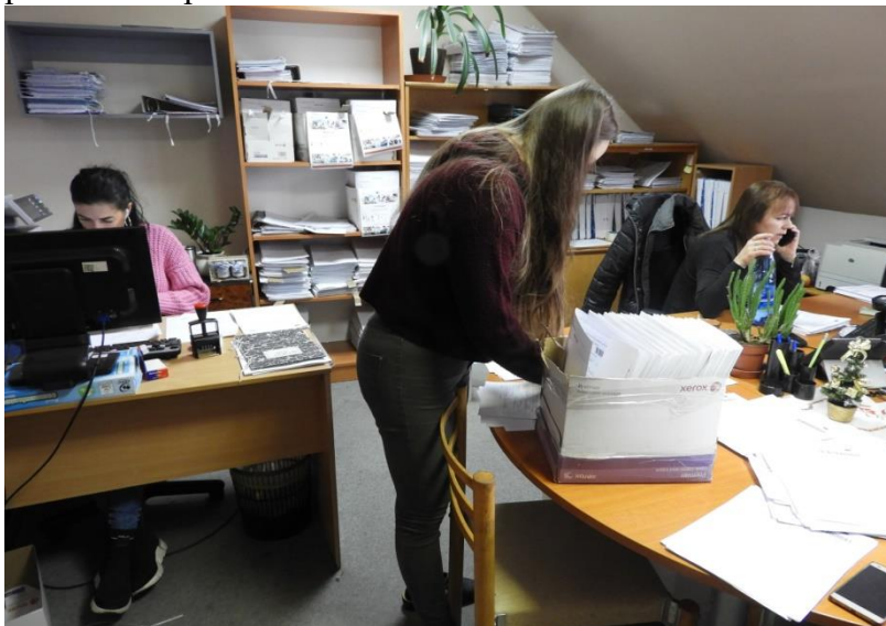
Foto č. 1 Úrad práce sociálnych vecí a rodiny v Lučenci vo svojej prevádzke vytvoril 28 pracovných miest na vykonávanie absolventskej praxe.

V súčasnej dobe prebieha implementácia projektu a hodnoty merateľných ukazovateľov sú priebežne napĺňané.