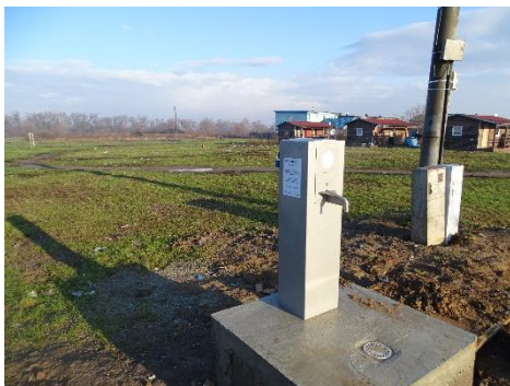
Foto č. 15 Výdajné miesto na pitnú vodu

Obec sa aktívne zapojila aj to výzvy v PO6 na prístup k verejne kontrolovanej vode, projektom Zlepšenie prístupu k pitnej vode v časti obce Pavlovce nad Uhom ulica Kukov, 312061S191, vybudovaním jedného výdajného miesta na pitnú vodu, ktoré bude prevádzkovať obec a ktorým zlepšila podmienky bývania 247 obyvateľom obce z prostredia MRK. Prostredníctvom projektu bolo zároveň cez uplatňovanie sociálneho aspektu vo verejnom obstarávaní vytvorené jedno pracovného miesto pre osobu z prostredia MRK. https://www.pavlovce.sk/zlepsenie-pristupu-k-pitnej-vode-v-casti-obce-pavlovce-nad-uhom-ulica-kukov.html