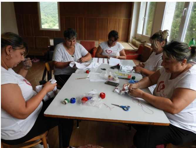
Foto č. 3 UPSVaR Rožňava, náplň práce zamestnanca prijatého na vytvorené pracovné miesto: Zhotovovanie krojov a ručné vyšívanie

Projekt REŠTART - Príležitosť pre dlhodobo nezamestnaných vrátiť sa na trh práce (312031J484), prijímateľa Ústredie práce, sociálnych vecí a rodiny , s celkovou zazmluvnenou sumou 15 617 477,27 € , má motivovať dlhodobo nezamestnaných uchádzačov o zamestnanie, ktorí sú bezprostredne pred zaradením do projektu v evidencii uchádzačov o zamestnanie viac ako 24 mesiacov, k nájdeniu si zamestnania alebo k účasti na zapracovaní za účelom získania resp. prehĺbovania praktických skúseností pre potreby trhu práce.