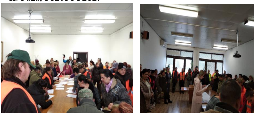
Foto č. 8 – 9 Preventívna aktivita národného projektu v obci: Predchádzanie dlhodobej nezamestnanosti v obci (PO5)

Aktuálne je v obci poskytovaná aj terénna sociálna práca cez PO5 a národný projekt Terénna sociálna práca a terénna práca v obciach s prítomnosťou marginalizovaných rómskych komunít II., 312051Z511 a v obci pôsobia i komunitní pracovníci cez ďalší národný projekt PO5 Komunitné služby v mestách a obciach s prítomnosťou marginalizovaných rómskych komunít – II. Fáza, 312051Y212.