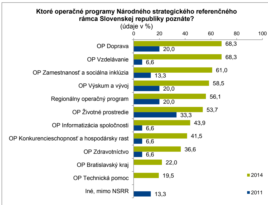
Graf č.2: Povedomie o konkrétnych operačných programoch